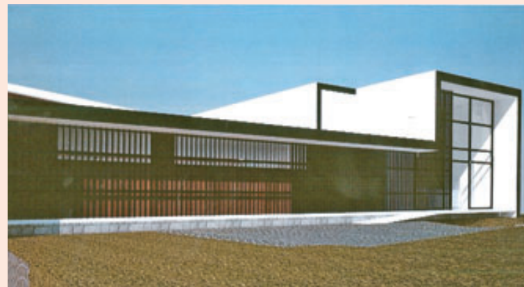
Imagen digital del centro de negocios que se construye en la colonia San Francisco, a un costo cercano al millón de dólares.

El valor de los aportes de los participantes, así como cualquier tipo de rendimiento que reciban, estará en función del resultado financiero de los activos del fondo, los cuales estarán aislados del riesgo general de la institución gestora.